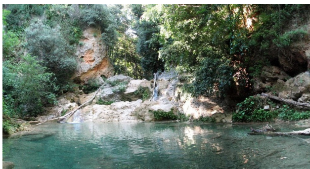
La salle verte

" Cette Salle verte était un petit cirque de rochers à pic couverts de végétation, où la Dardenne arrivait en cascates sur de gros blocs disposés avec une grâce sauvage, s'arrêtait tranquille pour former un tout petit lac, et sortait en recommençant à bondir et à gronder".